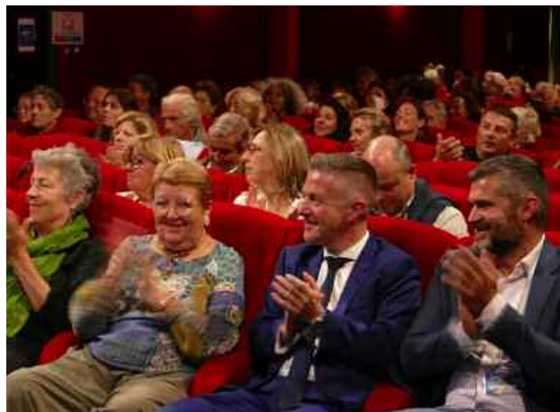
Une ville et un lieu accueillant pour l'exploration