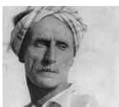
Henry de MONFREID

Fondée en 1937 par un groupe d'explorateurs passionnés parmi lesquels Henri de MONFREID, Louis AUDOUIN DUBREUIL, Théodore MONOD, Paul-Emile VICTOR, Ella MAILLARD, Jacques-Yves COUSTEAU, Alexandra DAVID NÉEL, Jean ROUCH... Cette Société mythique a été initialement nommée "Le Club des Explorateurs". Elle compte aujourd'hui 250 membres : scientifiques, écrivains voyageurs, journalistes, réalisateurs, diplomates et personnalités aux caractères bien trempés.