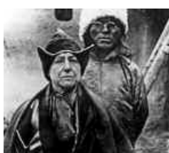
Alexandra DAVID NÉEL