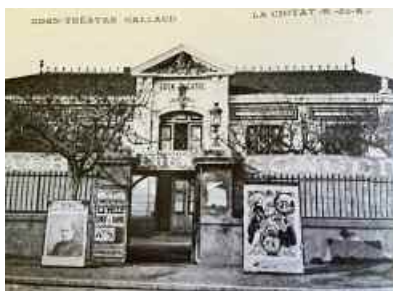
Le Cinéma Eden Théâtre à la belle époque