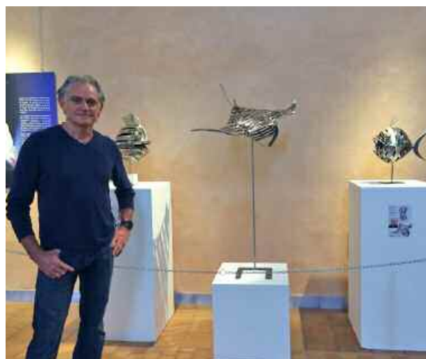
Trophées : météorites montées par l'artiste Pascal CLÉRY

GRAND PRIX LUMEXPLORE, BOURSE DE 3 000 €