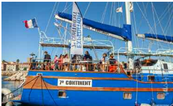
Port de plaisance de La Ciotat (Métropole)

septiemecontinent.com | seventh-continent.com