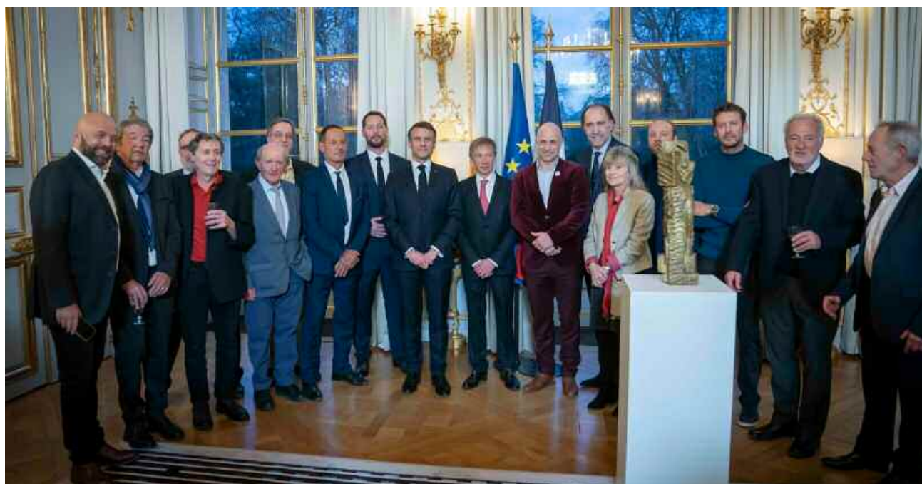
Quelques membres de la SEF dont Thomas PESQUET, reçus à l'Elysée par Emmanuel MACRON Le 8 mars 2024